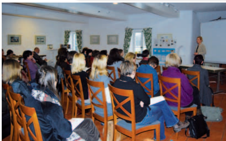
Oben: Plakat zur diesjährigen Gegengelesen-Ausstellung