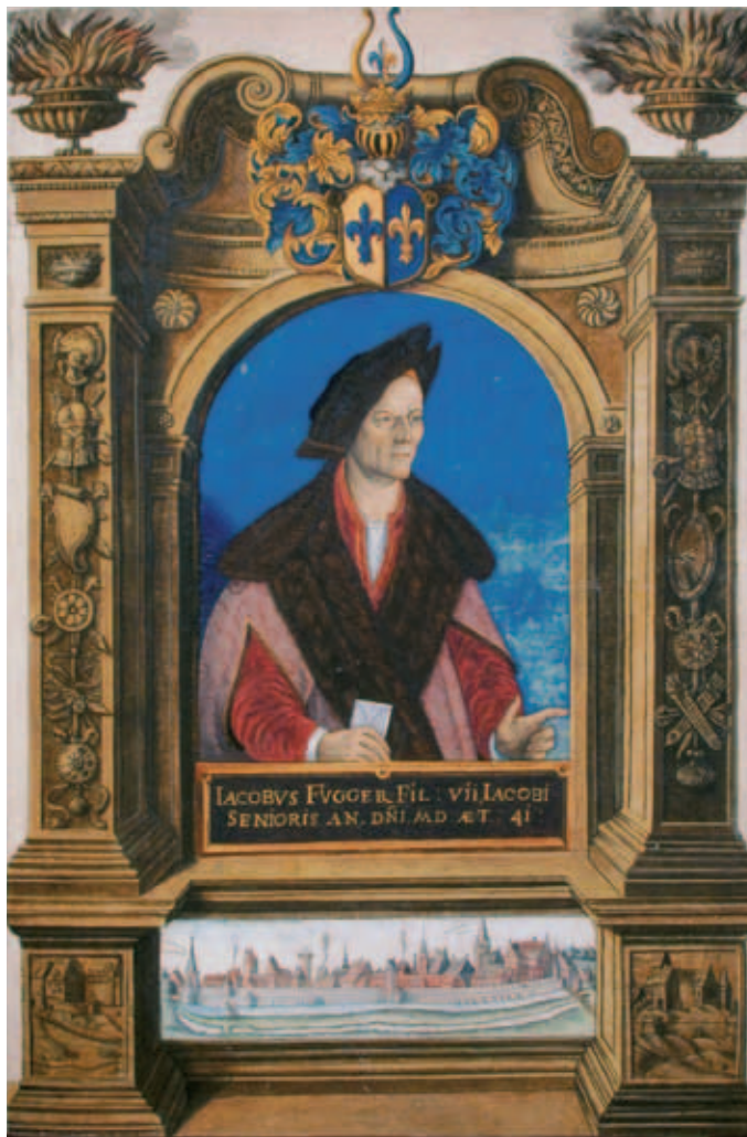
Blatt 4 Porträt Nr. 4: Aus der Kupferstichfolge „Fuggerorum et Fuggerarum... imagines“: Jakob Fugger der Reiche (1459–1525) im 41. Lebensjahr

Die beiden Schmuckstücke wurden im Herbst 2009 erstmals der Presse präsentiert; die Resonanz der Medien war enorm. Ab 10. März 2010 konnte schließlich die Öffentlichkeit die Neuerwerbungen in der Schatzkammerausstellung „Die Fugger im Bild. Selbstdar-