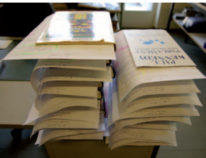
Literatur wartet auf die Produktion der Daisy-Hörbücher.

Sollten Sie Fragen haben oder weitere Informationen wünschen, können Sie sich jederzeit an uns wenden. Gerne stellen wir unser Informationsmaterial zur Verfügung.