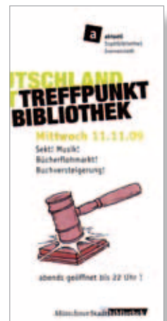
Werbeflyer der Münchner Stadtbibliothek

Eine ähnliche Idee hatte die Stadtbibliothek Cham, die einen SAMS-Tag in der Bibliothek veranstaltete. Während der außertourlichen Öffnungszeiten von 14 bis 20 Uhr am Samstag, 14. Novem-