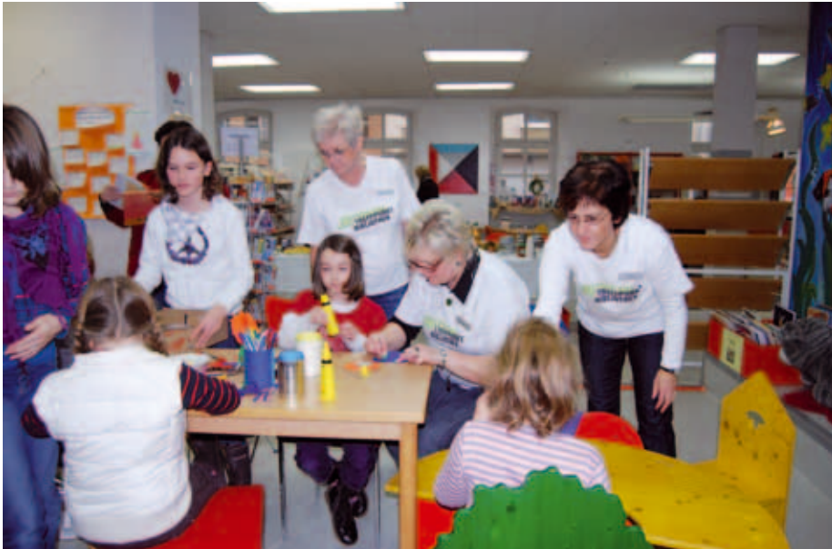
SAMS-Stiftebox- Basteln in der Stadtbibliothek Cham

ber 2009, konnten neue Leser Ausweise mit einer 50%igen Ermäßigung erwerben. Eine Finissage zur Ausstellung „Grenzerfahrungen“, ein Figurentheater für die Kleinen und das Basteln von SAMS-Stifteboxen rundeten den SAMS-Tag ab.