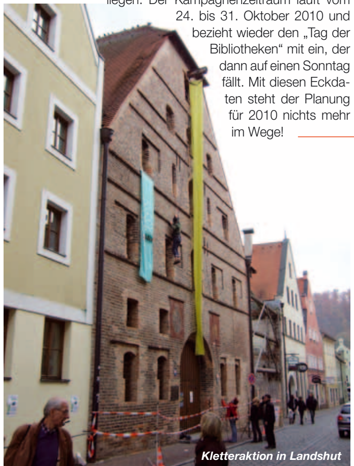
Kletteraktion in Landshut

24. bis 31. Oktober 2010 und bezieht wieder den „Tag der Bibliotheken“ mit ein, der dann auf einen Sonntag fällt. Mit diesen Eckdaten steht der Planung für 2010 nichts mehr im Wege!